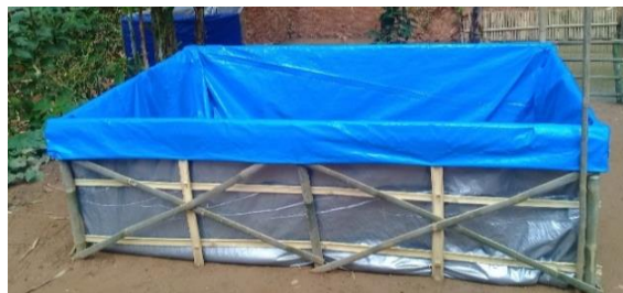
Gambar 3. Pembuatan Kolam Terpal

Pada periode ini praktik budidaya ikan lele dilakukan di kolam terpal. Kolam terpal dibuat luas 2 x 3 meter dengan rangka bambu. Setelah kolam sudah siap dan diberi air dan diberi obat, tahap selanjutnya adalah menyiapkan bibit atau membeli benih ikan lele. Benih ikan lele untuk pembesaran berbeda dengan pembenihan. Benih ikan lele untuk pembesaran ini dipilih dengan kisaran ukuran antara 5-7 cm.