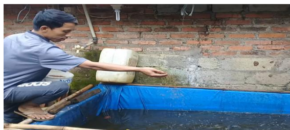
Gambar 4. Pemeliharaan di Kolam Terpal

Dilanjutkan dengan pemeliharaan. Pemeliharaan ini meliputi pemberian pakan dan obat serta pengurusan kolam ikan. Makanan ikan yang diberikan adalah pellet (full pellet) yang telah dicampur obat atau probiotik sehari dua kali, pagi dan sore hari. Sementara pengurusan kolam atau penggantian air dilakukan dua minggu sekali atau sesuai dengan kebutuhan.