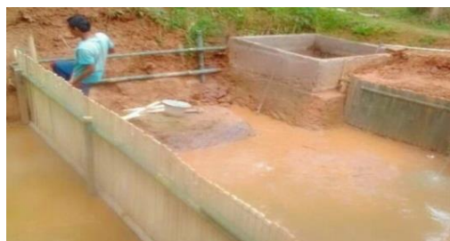
Gambar 5. Kolam Tanah

Belajar dari penyebab kegagalan pada periode pertama dengan menggunakan kolam terpal, pada periode kedua dilanjutkan dengan menggunakan kolam langsung di tanah. Selain untuk menggantikan kolam terpal yang gagal, kolam tanah juga dipilih karena lebih efisien dibandingkan dengan kolam terpal, tidak perlu menyewa atau membeli kolam, karena memanfaatkan kolam-kolam yang telah ada.