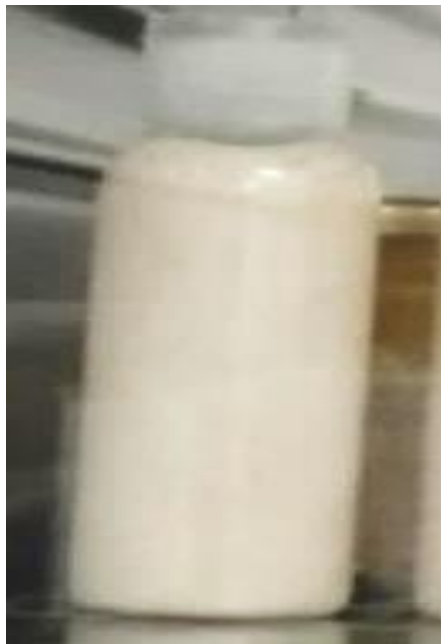
Gambar 2. Formula optimum sediaan clay facial soap