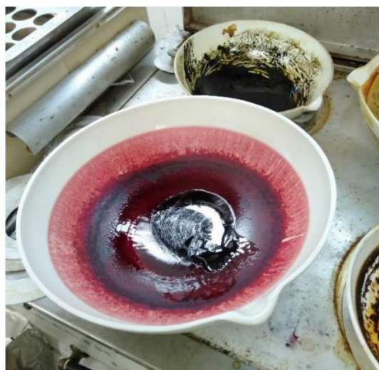
Gambar 1. Ekstrak kental bunga rosela

menjamin dan memastikan bahwa ekstrak yang dihasilkan memenuhi syarat yang telah ditetapkan (BPOM, 2000; Hartanti et al., 2022).