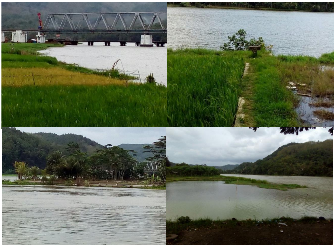
Gambar 4 Delta/ Sedimentasi/ Pendangkalan dasar sungai di Hulu Bendung Gerak Serayu [1]

Bendung Gerak Serayu ini memiliki karakteristik yang unik, mengingat terletak di segmen sungai dengan kemiringan landai. Salah satu sifat dari bendung dengan karakteristik seperti ini adalah mudah meningkatkan sedimen akibat rendahnya kecepatan aliran di hulu bendung. Oleh karena itu, dengan kontur yang landai tersebut, akan menyebabkan endapan sedimen cenderung tinggi. Saat ini, sedimentasi di hulu Bendung Gerak Serayu cenderung meningkat. Di samping ditunjukkan dengan kekeruhan air sungai, di hulu bendung sudah terbentuk banyak delta. Hal ini menunjukkan bahwa luasan tampang sungai sudah mulai berkurang akibat endapan atau sedimen yang membentuk delta. Perkembangan sedimen di hulu ini dirasa terus meningkat sejak tahun-tahun sebelumnya semenjak difungsikan bendung ini. Dengan penyempitan tampang sungai, atau pendangkalan akibat sedimentasi, akan berakibat pada pengurangan kapasitas debit di bendung gerak [1] [2] [5] [7].