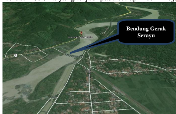
Gambar 1. Lokasi Bendung Gerak Serayu (Google-Earth, 2016) [1] [13]

Daerah Irigasi D.I Gambarsari – Pesangrahan terletak di wilayah Kabupaten Banyumas, Cilacap dan Kebumen dengan luas 20.795 ha yang meliputi wilayah Kabupaten Banyumas 3.264 ha, Kabupaten Cilacap 16.887 ha, Kabupaten Kebumen 644 ha. Daerah Irigasi ini juga difungsikan untuk memasok air baku untuk domestik munisipal dan industri kota Cilacap. Kroya dan Maos. Sebesar 5,26 m 3 / detik serta untuk mengatasi genangan pada daerah irigasi seluas 2.390 ha yang terjadi pada setiap musim hujan [1] [2] [5] [7] [13].