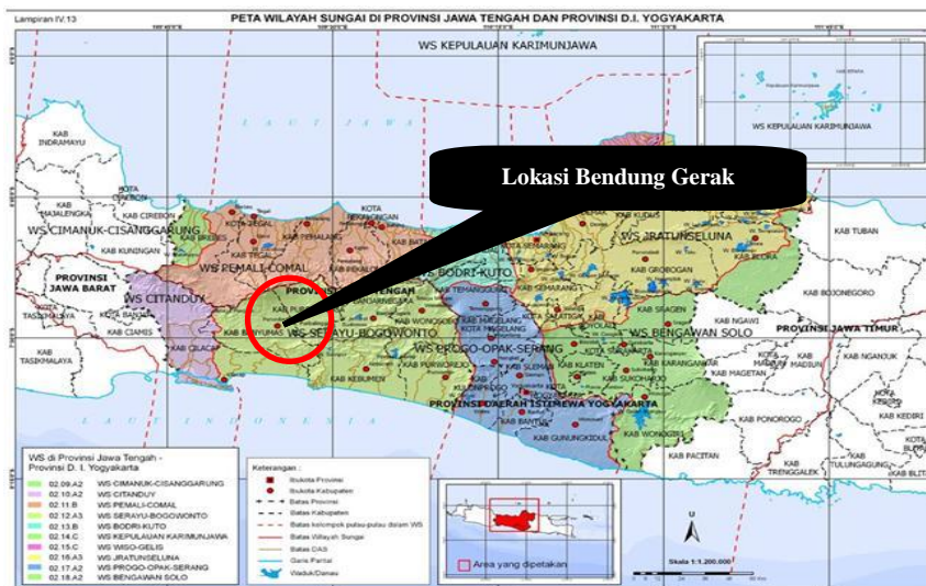
Gambar 5. Lokasi Penelitian

Lokasi Bendung Gerak Serayu terletak di Desa Kebasen, Kecamatan Rawalo, Kabupaten Banyumas, Provinsi Jawa Tengah atau tepatnya berada kurang lebih 4,2 km dari delta pertemuan Sungai Logawa dan Sungai Serayu. Bendung terletak pada koordinat 7.5187^{\circ} S, 109.2058^{\circ} E. Analisis difokuskan pada lokasi di hulu bendung Gerak Serayu dan Sungai Serayu di hulu bendung [1] [2][7][12][13].