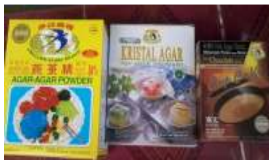
Gambar4. Olahan Rumput Laut Gracilaria sp dari Pabrik