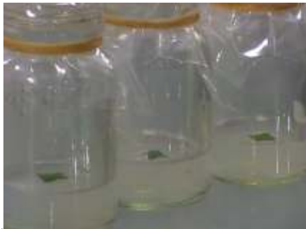
a. Eksplan umur 14 HST

Proses pencoklatan pada eksplan dalam penelitian ini diduga karena daun kencur yang digunakan sebagai eksplan memiliki kandungan senyawa fenol yang cukup tinggi. Seperti dikemukakan di atas bahwa di dalam tanaman kencur mengandung