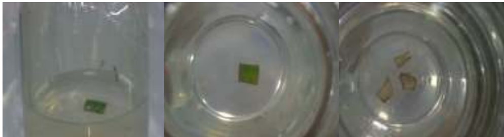
Gambar 2. Proses pencoklatan pada eksplan daun kencur yang ditanam dalam medium MS induksi kalus dengan modifikasi 2,4 D dan BAP selama penelitian.