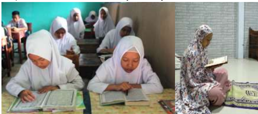
Gambar 1. Pembiasaan Membaca Alquran sebelum Pembelajaran PAI melalui model blended learning

Selama pembelajaran PAI melalui blended learning , guru menanamkan nilai-nilai religius dengan mengintegrasikan antara materi PAI dengan nilai-nilai yang terkandung pada materi tersebut. Rusadi (2020) menjelaskan bahwa salah satu upaya dalam mengembangkan pendidikan karakter siswa dalam pembelajaran PAI adalah dengan mengintegrasikan dengan kegiatan belajar mengajar. Selain itu, guru juga mengarahkan peserta didik untuk melakukan pembiasaan baik di sekolah atau di rumah. Metode pembiasaan ini bertujuan untuk membiasakan peserta didik melakukan ibadah dan kegiatan lain yang terpuji. Adanya pembiasaan ini diharapkan dapat membentuk karakter peserta didik. Siswanto, dkk (2021) menyatakan bahwa melalui metode pembiasaan dapat membekas dalam diri peserta didik serta lebih bermakna. Metode pembiasaan sangat tepat digunakan dalam mengembangkan karakter religius peserta didik dan mengamalkan ajaran-ajaran agama Islam dengan baik dan benar (Akhyar & Sutrawati, 2021). Akhyar & Sutrawati (2021) juga memaparkan bahwa metode pembiasaan dapat membangkitkan internalisasi nilai dengan cepat yang dilakukan secara terus menerus dan konsisten sampai menjadikan kebiasaan itu melekat pada diri peserta didik.