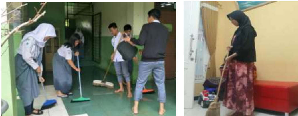
Gambar 3. Kegiatan menjaga kebersihan di sekolah dan di rumah

yang belajar di rumah juga telah membiasakan diri dengan membantu orang tua membersihkan lingkungan rumah seperti membersihkan kamar mandi, menyapu dan mengepel lantai, dan sebagainya.