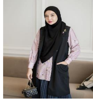
Gambar 10. Gambar di screenshot pada 17 November 2023 dari akun instagram @shireensungkar