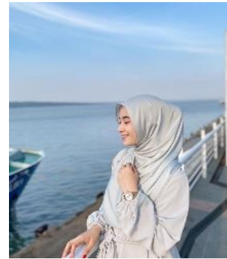
Gambar 12. Gambar di screenshot pada 17 November 2023 dari akun instagram

Perubahan citra perempuan berhijab merupakan hal yang positif. Perubahan ini menunjukkan bahwa perempuan berhijab semakin diakui dan diterima di masyarakat. Perubahan ini juga menunjukkan bahwa perempuan berhijab memiliki potensi yang besar untuk berkontribusi di berbagai bidang. Berdasarkan data dan analisis di atas, dapat disimpulkan bahwa perubahan citra perempuan berhijab merupakan hasil dari berbagai faktor, termasuk perubahan sosial dan budaya. Perubahan ini telah membawa dampak positif bagi perempuan berhijab, yaitu mereka kini lebih diakui dan diterima di masyarakat, serta memiliki potensi yang besar untuk berkontribusi di berbagai bidang.