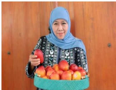
Gambar 7. Gambar di screenshot pada 17 November 2023 dari akun instagram @khofifah.ip