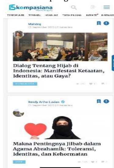
Gambar 6. Gambar di screenshot pada 16 November 2023 dari akun webset @kompasiana

Secara keseluruhan, media sosial telah memainkan peran yang penting dalam membentuk dan memengaruhi citra perempuan berhijab. Media sosial telah membantu untuk mendekonstruksi stereotip tentang perempuan berhijab dan menampilkan representasi perempuan berhijab yang lebih beragam dan positif (Magfirah 2020). Pembahasan mengenai peran media sosial dalam membentuk dan mempengaruhi citra perempuan berhijab diimplementasikan dengan menggunakan metode analisis yang telah disebutkan sebelumnya. Metode tersebut, yaitu pendekatan perilaku sosial,