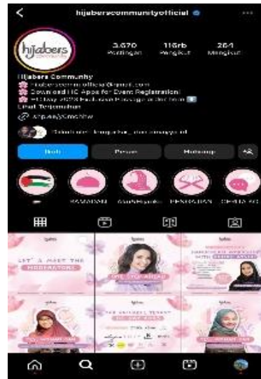
Gambar 5. Gambar di screenshot pada 16 November 2023 dari akun @hijaberscommunityofficial