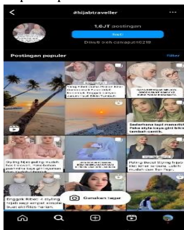
Gambar 2. Gambar di screenshot pada 16 November 2023 dari #hijabtraveller