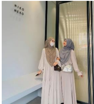
Gambar 11. Gambar di screenshot pada 17 November 2023 dari akun instagram