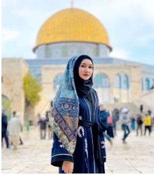
Gambar 9. Gambar di screenshot pada 17 November 2023 dari akun instagram @dianpelangi