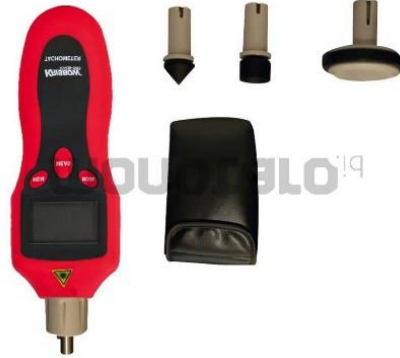
Gambar 3. Tachometer.

variable speed pada motor conveyor lalu diukur dengan tachometer dan hasil yang didapat adalah 26 m/m. Adapun alat yang dipergunakan sesuai Gambar 3 [11].