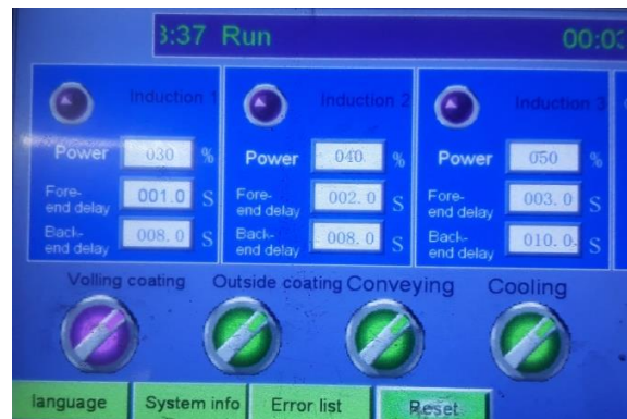
Gambar 5. Penentuan temperature.