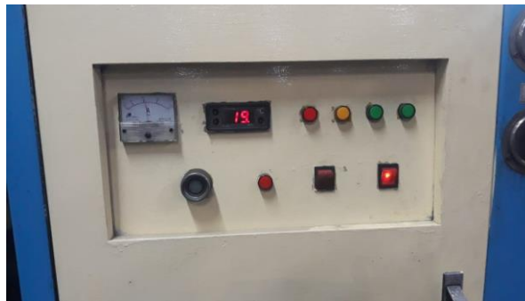
Gambar 6. Temperature chiller.

Chiller digunakan untuk mendinginkan conveyor, body heater dan panel dengan harapan mampu menjaga mesin supaya bekerja dengan optimal. Gambar 6 temperatur chiller standar untuk mesin induction adalah 18°C-21°C [14].