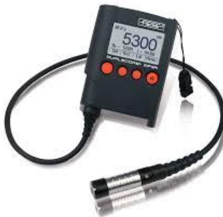
Gambar 7. Dual scope.

Setiap hasil dari percobaan akan di ukur lebar dan tebal dari lapisan lacquer. Gambar 7 lebar lacquer di ukur menggunakan caliper dengan standar lebar 12mm-15mm dan standar ketebalan lacquer 7,7 diukur menggunakan dual scope [15].