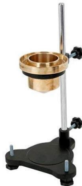
Gambar 4. Cup viscosity.

Standar viskositas lacquer pada proses ini adalah 18-23 detik. Gambar 4 viskositas lacquer yang digunakan 18 detik diukur menggunakan cup viscosity dan stopwatch [12].