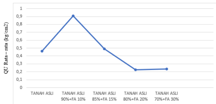
Gambar 4. Grafik uji kuat tekan bebas

Berdasarkan gambar diatas nilai optimum tertinggi terdapat pada komposisi variasi tanah asli 90%+Fly ash 10% dengan nilai optimum sebesar 0,91 kg/cm 2 , sedangkan nilai terendah pada variasi penambahan tanah asli 80%+fly ash 20% yaitu sebesar 0,227 kg/cm 2 . [10]