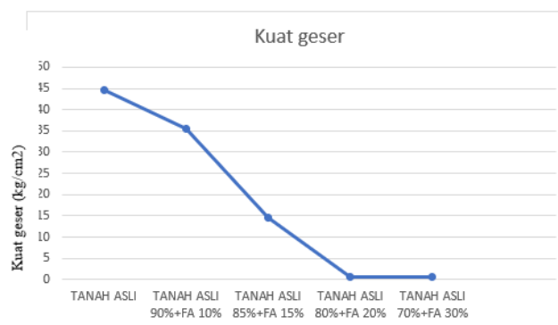
Gambar 3. Grafik kuat geser

Berdasarkan pada tabel diatas menunjukkan bahwa nilai kuat geser terendah pada komposisi variasi Tanah asli 80%+fly ash 20% yaitu 0,572 kg/cm 2 , Sedangkan nilai tertinggiya jatuh pada komposisi tanah asli yaitu 44,71 kg/cm 2 . Terjadinya suatu penurunan kuat geser yang diakibatkan oleh penambahan fly ash dari 10%,15%,20%,30%.[9]