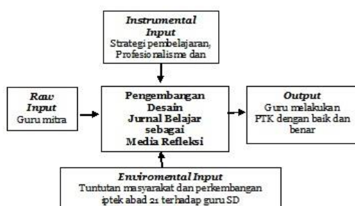
Bagan 1 Desain Komponen Penelitian

Proses pengembangan desain jurnal belajar sebagai refleksi pada diri guru ( raw input ) dan hasil yang dicapai untuk meningkatkan kemampuan dalam melakukan PTK ( output ), dipengaruhi oleh masukan lingkungan ( environmental input ) dan masukan sarana/instrumental ( instrumental input ) dan masukan lingkungan seperti tuntutan masyarakat dan perkembangan iptek abad 21. Masukan sarana/ instrumental yang