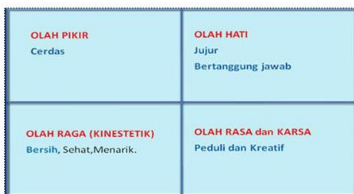
Gambar 3 Konfigurasi Karakter

Secara mikro pengembangan nilai/karakter dapat dibagi dalam empat pilar, yakni kegiatan belajar-mengajar di kelas,