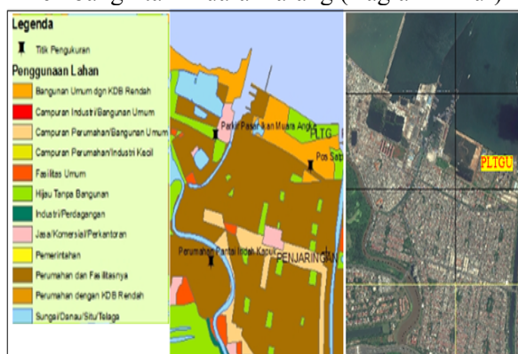
Gambar 3. Penggunaan Lahan disekitar Unit Pembangkitan Muara Karang (Bagian barat)