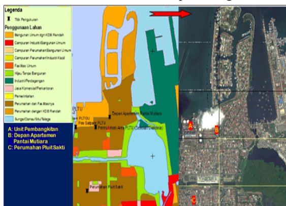
Gambar 2 Penggunaan Lahan disekitar Unit Pembangkitan Muara Karang (Bagian Timur)

Elemen berisiko manusia senantiasa berdampingan dengan elemen berisiko fisik yaitu berupa bangunan pemukiman disekitar Unit Pembangkitan Muarakarang. Bangunan pemukiman yang ada disekitar Unit Pembangkitan Muarakarang terbangun seiring dengan bertambahnya jumlah penduduk di Kelurahan Pluit (Rosyidin, 2015). Lingkungan sekitar Unit Pembangkitan Muara Karang merupakan area terbangun berupa permukiman. Area permukiman berada di jarak 50-100 meter disekitar sisi selatan dari unit pembangkitan.