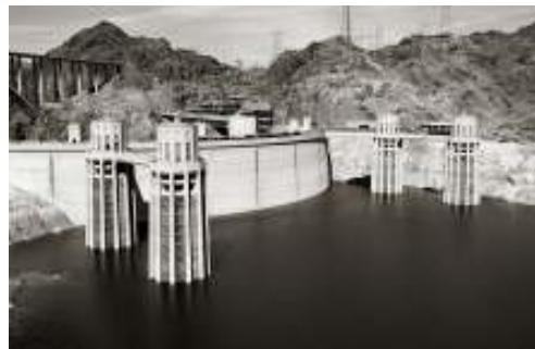
Gambar 2. Waduk

Selanjutnya bendungan perennial , berupa bendungan permanen atau waduk untuk menampung jumlah air yang besar. Airnya dimanfaatkan untuk irigasi, sekaligus untuk sumber resapan air tanah. Dasar waduk biasanya cepat terjadi pendangkalan sehingga menutup ruang-ruang atau pori-pori untuk peresapan. Metode menyebar lainnya adalah alur-alur parit ( Ditch and Furrow ), berupa alur-alur parit memanjang dan berderet-deret, cukup rapat dengan kelerengang sangat rendah.