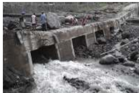
Gambar 3. Bendung lahar

Cara lainnya adalah penggenangan, atau pembanjiran ( flooding ). Cara ini banyak dilakukan di wilayah yang relatif datar dan luas. Cara lain yang banyak dilakukan karena berkaitan dengan pertanian adalah irigasi. Irigasi atau pengairan di lahan pertanian merupakan cara peresapan air ke dalam tanah. Ada juga dengan modifikasi saluran sungai, dengan cara membuat pematang melintang dasar sungai. Dengan demikian aliran air tertahan, sehingga menyebabkan air banyak meresap.