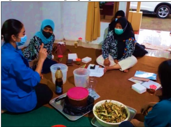
Gambar 2. Praktik Pembuatan Eco-Enzyme Kelompok 1

disimpan di wadah-wadah sesuai dengan kebutuhan. Eco-enzyme ini tidak memiliki masa kadaluwarsa selagi tidak terkontaminasi. Eco-enzyme yang sudah jadi dapat digunakan langsung dengan cara mengencerkan terlebih dahulu dengan air. Eco-enzyme dapat digunakan sebagai cairan pembersih atau desinfektan. Selain itu eco-enzyme juga dapat digunakan sebagai pupuk tanaman dll.