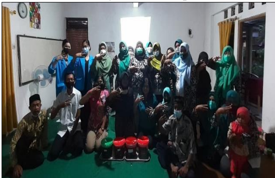
Gambar 4. Peserta Sosialisasi dan Pelatihan Eco-enzyme

Pada akhir kegiatan para peserta diminta untuk mengisi kuesioner terkait dengan kegiatan pengabdian yang telah dilaksanakan. Berdasarkan hasil perhitungan diperoleh skor rata-rata respon peserta pada kegiatan pengabdian masyarakat adalah 3,5. Nilai tersebut menunjukkan rata-rata peserta menilai kesesuaian program, materi maupun fasilitator pada kegiatan ini Sangat Baik. Hasil dari kuesioner tanggapan peserta tentang kegiatan pengabdian ini dapat dilihat pada Gambar 5.