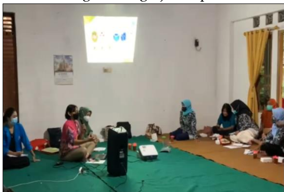
Gambar 1. Pemaparan Materi Pengolahan Sisa Organik Menjadi Eco Enzyme

Pada pelaksanaan kegiatan pengabdian masyarakat ini, pengabdian dan tim melakukan penilaian gambaran pengetahuan kelompok sasaran terkait pengolahan sisa sampah organik menjadi eco-enzyme. Penilaian pengetahuan peserta menggunakan kuesioner tertutup yang terdiri dari 10 soal pertanyaan. Pengisian pre-test dilakukan sebelum pemaparan materi. Selanjutnya, setelah pemaparan materi dilakukan dalam waktu kurang lebih 1 jam peserta melakukan praktik pembuatan eco-enzyme dan diakhiri dengan mengerjakan post-test.