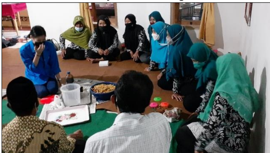
Gambar 3. Praktik Pembuatan Eco-Enzyme Kelompok 2