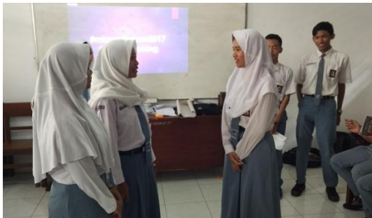
Gambar 1. Roleplay untuk Pendalaman Materi

Setelah pendalaman materi, siswa diwajibkan untuk membuat Rencana Tindak Lanjut (RTL) secara mandiri. Rencana Tindak Lanjut adalah daftar aktivitas-aktivitas yang akan dilakukan siswa untuk lebih jauh membagikan pengetahuan migrasi aman kepada teman-teman atau lingkungannya. Berikut adalah rencana tindak lanjut yang disusun siswa peserta pelatihan: