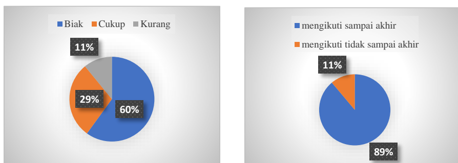
Gambar 3. Grafik rata-rata capaian terapi aktivitas kelompok tari tradisional Uri-uri sebagai perilaku positif selama 6 pertemuan oleh ODGJ di desa Srigonco

Tari tradisional Uri-uri ini juga menjadikan sebagai bentuk advokasi bagi ODGJ di desa Srigonco dalam mengurangi masalah seperti stigma negatif pada ODGJ di desa tersebut. Sehingga ODGJ mampu meningkatkan perilaku positif dimasyarakat melalui pendekatan budaya lokal. Posyandu sehat jiwa merupakan sebuah bentuk pemberdayaan yang ada di