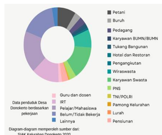
Gambar 2. Data Penduduk Desa Donokerto berdasarkan Pekerjaan