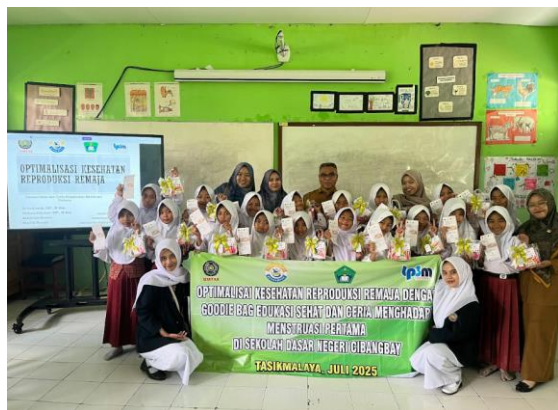
Gambar 3. Foto Bersama peserta dan Tim Pengabdian Masyarakat dengan SD Cibangbay

Kemudian diberikan gambaran kegiatan yang akan dilakukan dengan memberikan pemaparan masalah Kesehatan reproduksi yang terjadi pada remaja awal dan tujuan dilaksanakannya edukasi ini selama 30 menit. Selama proses edukasi tentang persiapan menarche berlangsung, peserta terlihat semangat dan antusias dengan tema yang disampaikan. Selanjutnya sesi tanya jawab, para remaja secara bergantian mengajukan pertanyaan mengenai persiapan menstruasi pertama diantaranya apa saja yang harus dilakukan ketika datangnya menstruasi, cara mengganti pembalut, berapa kali sehari ganti pembalut, jenis pembalut. Hasil evaluasi setelah dilakukan edukasi menunjukkan bahwa Sebagian besar remaja merasa edukasi ini sangat penting untuk persiapan menstruasi pertama. Beberapa remaja menyampaikan bahwa edukasi persiapan menstruasi pertama ini sangat penting dilaksanakan, berhubung para remaja yang sedang berada dalam kondisi periode antara kanak-kanak ke periode remaja yang memerlukan banyak bimbingan dan informasi khususnya mengenai reproduksi terutama menstruasi pertama yang merupakan salah satu dari