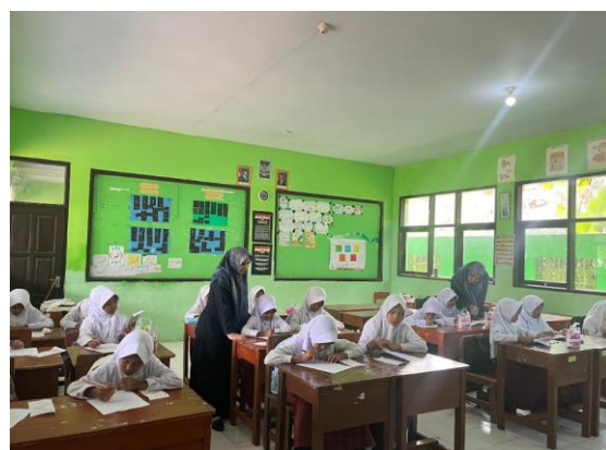
Gambar 2. Pelaksanaan Kegiatan Pengabdian Masyarakat

Kegiatan pengabdian kepada masyarakat ini diawali dengan pengukuran pengetahuan peserta penyuluhan sebelum diberi pemaparan penyuluhan menggunakan soal pretest dengan diberikannya kuesioner pengetahuan menarche (menstruasi pertama) remaja putri, dengan waktu 30 menit seperti terlihat pada Gambar 3 .