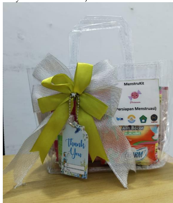
Gambar 1. Goodie Bag Persiapan Menarche

tersebut bagi siswa sekolah dasar (Komang Sulyastini et al. 2024)