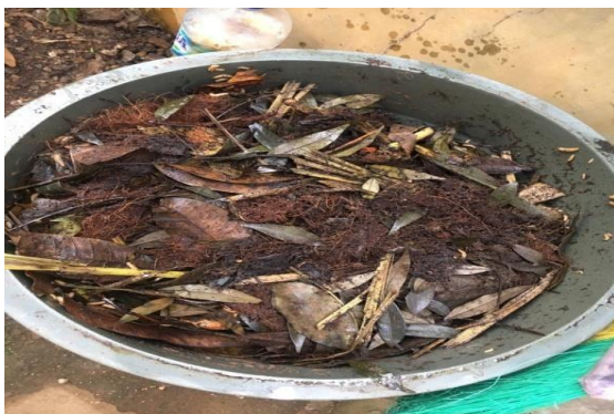
Gambar 3. Pendampingan IRT Membuat Pupuk

Selanjutnya program yang telah kami lakukan ialah dengan melakukan pendampingan pada tanggal 12 Mei 2020 dilakukan secara online menggunakan aplikasi Webex , kegiatan ini yaitu penyampaian materi akhlak bisnis dengan pendekatan secara islami dari Dosen Fakultas Syariah yaitu penyuluhan pemahaman terkait akhlak bisnis, dimana ibu-ibu rumah tangga Kecamatan Mandalajati diberikan ilmu pengetahuan dan wawasan bagaimana akhlak dalam produksi yang baik secara islam, dan akhlak berdagang dalam islam, hal ini dilakukan upaya kami untuk meningkatkan kesadaran serta minat ibu-ibu rumah tangga dalam mengelola sampah basah