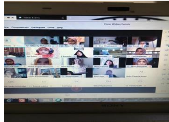
Gambar 4. Penyuluhan & Pendampingan IRT Mengenai Akhlak Produksi & Dagang

menjadi pupuk yang dapat dijual sehingga memberikan pendapatan tambahan bagi ibu rumah tangga.