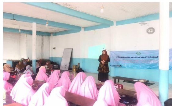
Gambar 2. Penyuluhan Mengenai Manajemen Sampah

Program pendampingan ibu rumah tangga yang telah kami lakukan ialah dengan mengadakan penyuluhan pada tanggal 11 Maret 2020 kepada ibu-ibu rumah tangga di Kecamatan Mandalajati dari Dosen Fakultas Syariah serta ketua Ibu PKK Kec. Mandajati yaitu membahas Manajemen Sampah dengan memberikan ilmu pengetahuan dan wawasan kepada ibu rumah tangga mulai dari membedakan sampah organik dengan sampah an-organik, manfaat sampah, dampak sampah serta memotivasi ibu rumah tangga untuk meningkatkan kesadaran dalam mengelola sampah dirumah, sehingga dapat memberikan contoh di lingkungan rumah dan sekitar dalam memanfaatkan sampah serta menjaga lingkungan yang bersih dan sehat. Hal ini sesuai dengan penelitian Muhammad Rais Rahmat Razak dkk yang mengatakan pentingnya memperbaiki perilaku dalam menjaga kesehatan lingkungan. (Seputra 2020)