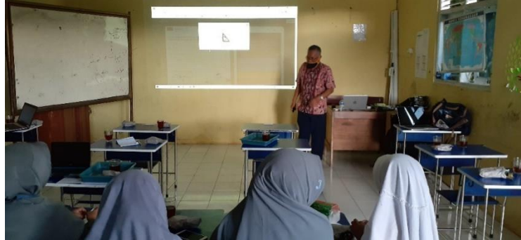
Gambar 1. Penyampaian teori aplikasi Quizizz

Contoh mata pelajaran yang sudah dibuat model soal daring dengan aplikasi Quizizz misalnya: mata pelajaran bahasa Inggris, matematika, bahasa Indonesia dan sebagainya.