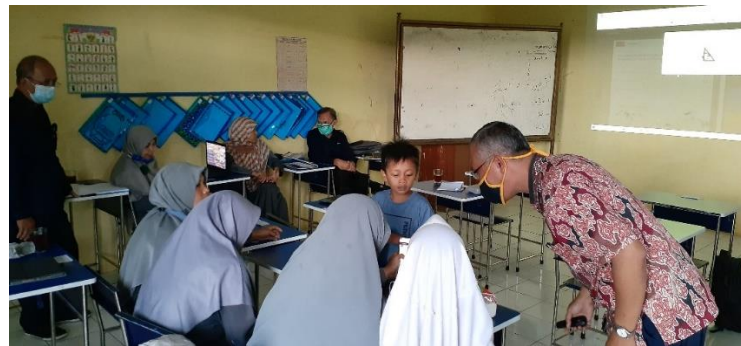
Gambar 2. Foto kegiatan saat praktek