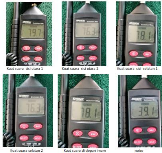
Gambar 3. Pengukuran kuat suara dalam masjid

Gambar 2., memperlihatkan tata letak speaker coloumb dalam masjid, peletakan speaker menyesuaikan tinggi ruangan dan luasan masjid serta letak duduk jamaah. Posisi speaker yang sesuai dengan kondisi diatas bertujuan untuk mendapatkan suara yang jelas dan cukup nyaman ditelinga. Gambar 3., memberikan hasil pengukuran kuat suara pada beberapa lokasi duduk jamaah yaitu berkisar antara 60 - 80 desibel.