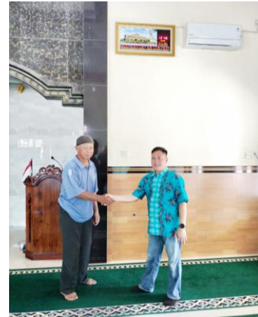
Gambar 7. Foto kegiatan koordinasi dan serah terima kegiatan dengan takmir masjid

Gambar 6., memperlihatkan tata letak sistem audio seperti amplifier , mixer dan equaliser. Penempatan pada ruangan yang cukup luas berfungsi untuk melindungi utilitas sistem audio agar mudah perawatannya dan gambar 7., adalah foto kegiatan koordinasi tim ibm dengan pengurus masjid serta gambar serah terima ketua kegiatan dengan takmir masjid.