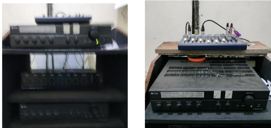
Tata letak utilitas sistem audio : ampifier, mixer dan equaliser

Gambar 4., memperlihatkan tata letak speaker horn luar masjid, peletakan horn menyesuaikan tinggi menara dan luasan masjid serta tempat tinggal jamaah. Posisi speaker yang sesuai dengan kondisi diatas bertujuan untk mendapatkan suara yang jelas dan cukup nyaman ditelinga. Gambar 5., memberikan hasil pengukuran kuat suara pada beberapa lokasi rumah jamaah yang berjarak 20 - 40 meter yaitu berkisar antara 60 - 80 desibel.