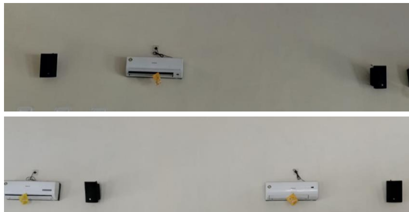
Gambar 2. Tata Letak Speaker Coloumb dalam masjid

Instalasi audio dimulai dari pemasangan instalasi speaker dalam masjid dengan perhitungan luas masjid 72 m 2 sehingga ditetapkan dengan memberikan speaker jenis columb 15 watt sejumlah 4 unit dan amplifier sebesar 90 watt. Speaker ini terpasang pada dinding masjid menghadap ke lantai pada posisi tengah (Gambar 2). Suara yang dihasilkan mampu menjangkau 4 meter dari pusat speaker dengan kekuatan suara \pm 60 db Instalasi berikutnya yaitu instalasi untuk penguat suara luar ruangan menggunakan horn 2 x 60 watt. Sistem pengatur suara dan perangkat amplifier dipasang pada ruangan tersendiri yang aman dari gangguan manusia maupun gangguan alam seperti hujan dan bebas dari debu dengan sirkulasi udara yang bagus. Instalasi berikutnya merupakan instalasi kelistrikan, mikrofon dan sistem kontrol pengeras suara.