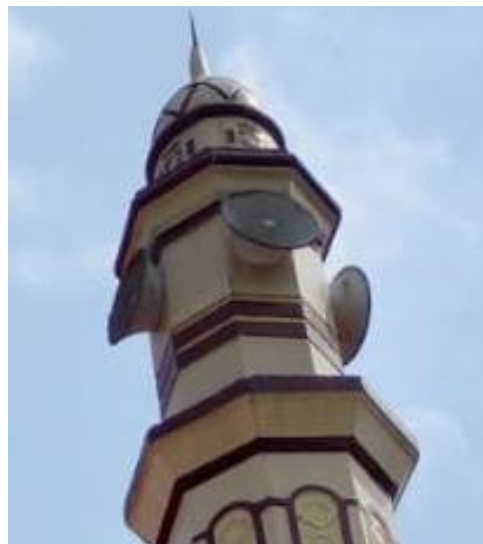
Gambar 4. Tata Letak Horn untuk audio luar masjid

Gambar 2., memperlihatkan tata letak speaker coloumb dalam masjid, peletakan speaker menyesuaikan tinggi ruangan dan luasan masjid serta letak duduk jamaah. Posisi speaker yang sesuai dengan kondisi diatas bertujuan untuk mendapatkan suara yang jelas dan cukup nyaman ditelinga. Gambar 3., memberikan hasil pengukuran kuat suara pada beberapa lokasi duduk jamaah yaitu berkisar antara 60 - 80 desibel.