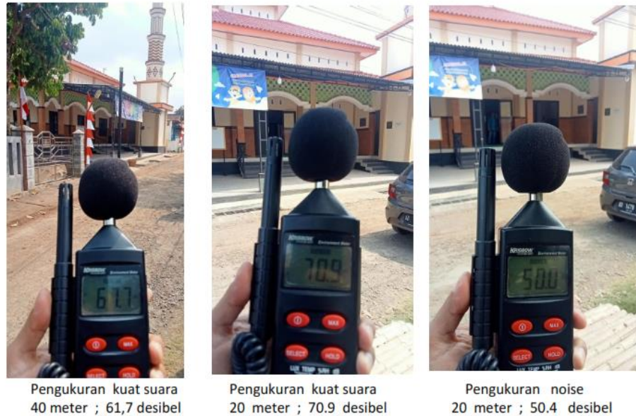
Gambar 5. Pengukuran kuat suara luar masjid

Gambar 4., memperlihatkan tata letak speaker horn luar masjid, peletakan horn menyesuaikan tinggi menara dan luasan masjid serta tempat tinggal jamaah. Posisi speaker yang sesuai dengan kondisi diatas bertujuan untk mendapatkan suara yang jelas dan cukup nyaman ditelinga. Gambar 5., memberikan hasil pengukuran kuat suara pada beberapa lokasi rumah jamaah yang berjarak 20 - 40 meter yaitu berkisar antara 60 - 80 desibel.