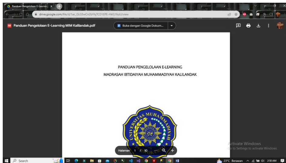
Gambar 2. Modul Pengelolaan E-Learning MIM Kalilandak

Modul yang dibuat untuk E-Learning meliputi pengelolaan administrator yang didalamnya terdapat pengelolaan untuk user guru dan murid, dimana dalam pengelolaan tersebut akan ada proses memasukkan guru dan murid ke dalam kelas tertentu untuk dapat menjalankan proses E-Learning . Selain itu juga modul pengelolaan ini terdapat bagaimana cara merubah tema dari aplikasi moodle tersebut agar bisa disesuaikan dengan kebutuhan dari MIM Kalilandak. Modul pengelolaan dari E-Learning MIM Kalilandak bisa diakses di https://bit.ly/E-LearningMIMKalilandak (Gambar 2).