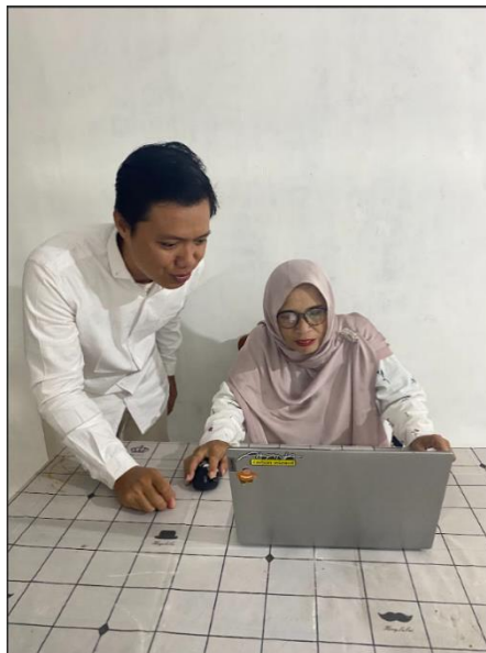
Gambar 4. Pendampingan Pengelolaan E-Learning MIM Kalilandak

Setelah modul dan video pengelolaan E-Learning di MIM kalilandak selesai, kemudian dilakukan proses pendampingan agar supaya kendala-kendala teknis dalam proses pengelolaan dapat teratasi. Pendampingan ini diberikan kepada dua guru dari MIM Kalilandak yang merupakan pengelola dari MIM Kalilandak pada tanggal 24 Juni 2023 (Gambar 4).