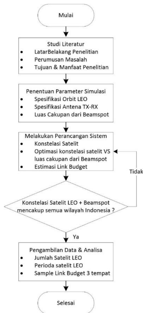
Gambar 1 Alur Penelitian

Alur penelitian terlihat pada gambar 1 dimana proses perancangan konstelasi satelit LEO dibuat.