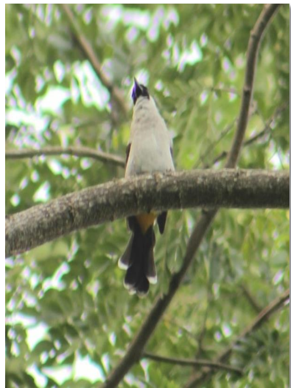
Gambar 3. Pycnonotus aurigaster terlihat bertengger di Pohon Taman Samarendah

Sedangkan nilai indeks kemelimpahan relatif Pycnonotus aurigaster sebesar 16.38% sehingga termasuk dalam kategori sedang. Burung ini populasinya cukup banyak dan hampir dapat ditemui diberbagai lokasi dan habitat yang berbeda-beda seperti hutan sekunder, kawasan terbuka, semak dan padang rumput (Fikriyanti et al., 2018). Dengan kondisi Taman Samarendah ditumbuhi beberapa jenis vegetasi sehingga cocok sebagai dengan habitat P. aurigaster ( Gambar 3 ).