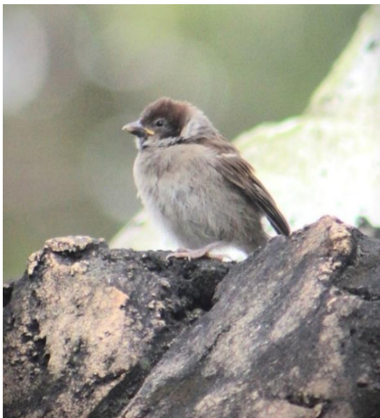
Gambar 2. Passer montanus sedang bertengger di sekitar kolam air Taman Samarendah

Adapun nilai indeks kemelimpahan relatif yang paling tinggi yaitu Passer montanus sebesar 56.03% dimana nilai tersebut masuk dalam kategori tinggi. Hasil ini menunjukkan bahwa tingkat kepadatan populasi P. montanus dalam ekosistem Taman Samarendah ( Gambar 2 ) lebih tinggi dari pada jenis burung lainnya.