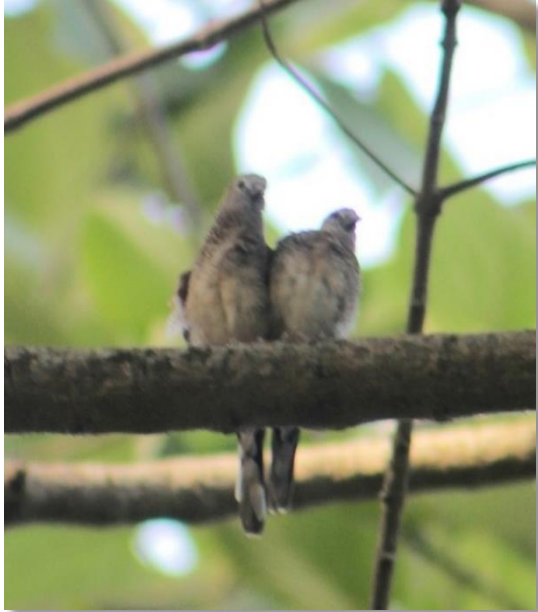
Gambar 4. Sepasang Geopelia striata sedang bertengger di Pohon Taman Samarendah

indeks pemerataan yang diperoleh tersebut menunjukkan bahwa distribusi antar spesies burung yang terdapat di Taman Samarendah relatif sama dan tidak ada dominansi diantara spesies tersebut.(Fikriyanti et al., 2018).