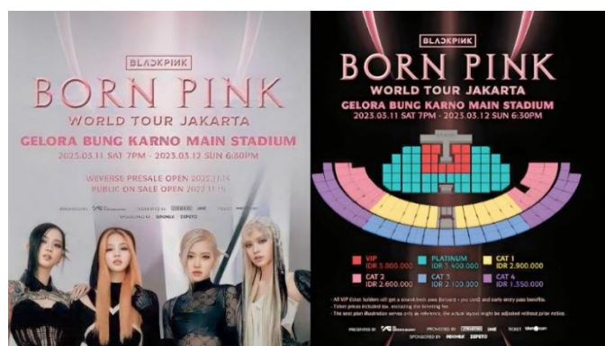
Gambar 2. Rate Harga Tiket Konser BlackPink

Konsumerisme, seringkali merujuk pada kecenderungan seseorang yang fokus pada konsumsi dan peningkatan materialistik. Perilaku konsumtif bisa diartikan sebagai kecenderungan seseorang untuk terus-menerus membeli barang dan menghabiskan uang dengan intensitas yang tinggi. Menurut (Baudrillard 2020), " growth means affluence and affluence means democracy " yang dapat diartikan bahwasanya konsumerisme di dalam masyarakat didorong oleh adanya pertumbuhan ekonomi yang kemudian mendorong adanya industrialisasi. Perkembangan industri, kemajuan teknologi, dan meningkatnya ketersediaan barang konsumsi secara tidak langsung juga telah menciptakan lingkungan yang mendorong seseorang untuk memiliki perilaku konsumtif. Dapat dilihat rate harga tiket konser BlackPink saat konser di Jakarta beberapa saat lalu di bawah ini: