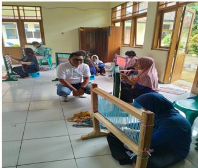
Gambar 1. Pelatihan membuat keset

Setelah mencapai tujuan rehabilitasi, tahap penghentian adalah tahap akhir dari pelayanan. Dalam hal seorang penyandang cacat menarik diri atau meninggal, mereka dikembalikan ke keluarga mereka atau lembaga lain.