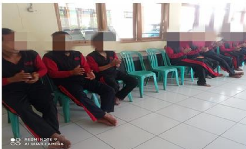
Gambar 2. Gestur Tubuh merupakan sebagai tanda dukungan atau pengertian antar sesama.

Dalam sebuah Konseling eks ODGJ di Rumah Pelayanan Sosial PMKS “Pamardi Raharjo” menunjukkan pola komunikasi primer. Seorang Konselor melakukan interaksi dengan menggunakan simbol-simbol verbal dan non verbal kepada Konseli. Symbol verbal digunakan untuk berdialog dan non verbal biasanya dilakukan untuk membantu konselor menjalin ikatan dalam konseling agar konseli merasa nyaman. dan merasa diberi rasa empati (Suseno & Said, 2023). Komunikasi verbal yang sering dilakukan oleh komunikasi penghuni panti eks ODGJ adalah komunikasi verbal dengan bahasa yang sederhana, singkat dan mudah dimengerti. Pada saat interaksi pada saat pembuatan keset, biasanya diselingi dengan istilah khusus seperti warna, jenis kain.