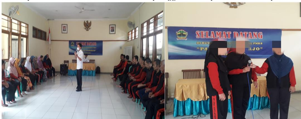
Gambar 4. Pada saat pemberian bimbingan, aktivitas kelompok yang dilakukan menggunakan bahasa yang sederhana, singkat dan mudah dimengerti

Selain itu Rumah Pelayanan Sosial PMKS "Pamardi Raharjo" memperhatikan pula faktor-faktor lingkungan yang memengaruhi pola komunikasi dalam kelompok eks, seperti kepadatan populasi, fasilitas yang tersedia, dan norma-norma sosial yang berlaku. Penelitian menyoroti pentingnya menciptakan lingkungan yang inklusif, aman, dan mendukung bagi anggota kelompok untuk berinteraksi dan berkomunikasi secara positif. Dengan memahami dinamika pola komunikasi ini, kita dapat mengembangkan strategi intervensi yang lebih efektif dalam meningkatkan interaksi sosial, keterampilan komunikasi, dan kualitas hidup anggota kelompok eks ODGJ di panti rehabilitasi.