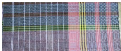
Gambar 7. Oles dalam tradisi Memere Nakan Pagit

bersifat fisik sebagai penutup tubuh, tetapi juga merepresentasikan bentuk penjagaan terhadap ibu dan janin, baik secara jasmani maupun spiritual. Secara kultural, penggunaan oles mencerminkan adanya perhatian kolektif keluarga terhadap kondisi ibu hamil. Kehangatan yang diberikan melalui oles melambangkan kasih sayang, kepedulian, dan harapan agar ibu tetap dalam kondisi sehat dan terhindar dari gangguan. Dalam perspektif simbolik, oles juga dapat dipahami sebagai “pelindung” yang membungkus ibu, seolah-olah menciptakan ruang aman yang menjaga keberlangsungan kehidupan yang sedang dikandung.