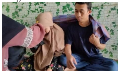
Gambar 10. Pemakaian Oles dalam tradisi Memere Nakan Pagit