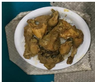
Gambar 13. Makanan yang disajikan dalam tradisi Mengkelembisi

Berdasarkan kutipan wawancara tersebut dapat dipahami bahwa pelaksanaan tradisi Mengkelembisi dilakukan melalui beberapa tahapan yang memiliki makna simbolik. Kedatangan keluarga ke rumah ibu yang baru melahirkan dengan membawa makanan dan lauk-pauk, terutama ayam yang telah dipotong sesuai ketentuan adat. Ini menandai bahwa kelahiran anak bukan urusan pribadi, tetapi peristiwa sosial yang melibatkan jaringan kekerabatan. Adapun makanan yang disajikan yaitu dapat dilihat dari gambar berikut: