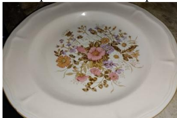
Gambar 4. Pingg dalam tradisi Memere Nakan Pagit