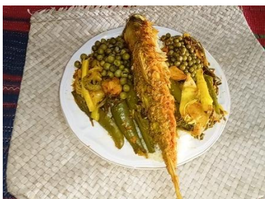
Gambar 8. Makanan yang disajikan dalam tradisi Memere Nakan Pagit