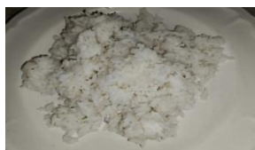
Gambar 1. Nakan dalam tradisi Memere Nakan Pagit

(1) Nakan (nasi) merupakan bahan pokok yang sangat penting dalam tradisi Memere Nakan Pagit . Secara simbolik, beras melambangkan kehidupan, kesuburan, dan keberlanjutan generasi. Nasi dan disajikan bersama lauk serta sayuran dimaknai sebagai simbol fondasi kehidupan. Artinya, anak yang akan lahir diharapkan memiliki dasar hidup yang kuat, stabil, dan sejahtera.