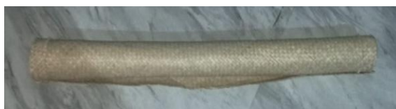
Gambar 5. Blagen Mbetar tradisi Memere Nakan Pagit