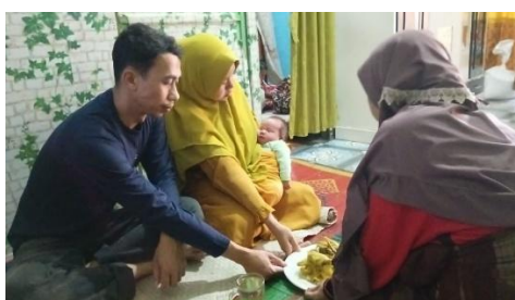
Gambar 14. Penyerahan makanan dalam tradisi Mengkelembisi

Ungkapan tersebut merupakan bentuk nasihat dan doa yang disampaikan kepada perempuan yang telah melahirkan sebagai bagian dari proses pemulihan dan penguatan peran barunya sebagai ibu. Secara simbolik, pemberian nasi kelembis melambangkan perhatian, kepedulian, dan tanggung jawab keluarga terhadap kondisi fisik dan emosional ibu pasca persalinan. Selain itu, nasi kelembis juga dimaknai sebagai simbol pemulihan, kekuatan, dan perlindungan, dengan harapan agar ibu segera pulih, tetap sehat, serta mampu merawat bayinya dengan baik. Melalui praktik ini, keluarga tidak hanya memberikan dukungan secara material, tetapi juga menyampaikan doa, harapan, dan nilai-nilai budaya yang memperkuat ikatan emosional serta solidaritas dalam lingkungan kekerabatan.