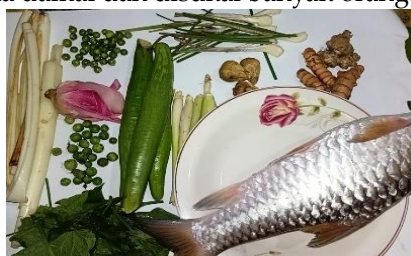
Gambar 3. Bahan Makanan dalam tradisi Memere Nakan Pagit