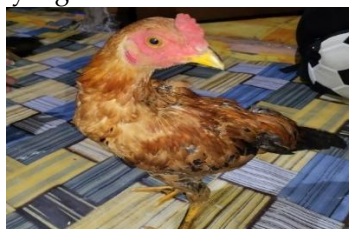
Gambar 12. Manuk dalam tradisi Mengkelembisi