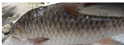
Gambar 2. Ikan Batang Lae dalam tradisi Memere Nakan Pagit

(2) Ikan Batang Lae atau ikan jurung merupakan lauk utama dalam Memere Nakan Pagit . Sebagai ikan yang hidup di perairan jernih dan berarus deras, ikan jurung melambangkan kejernihan, kekuatan, dan ketekunan. Secara simbolik, ia merepresentasikan harapan agar anak yang dikandung tumbuh menjadi pribadi yang bermartabat, sehat, dan mampu menghadapi tantangan hidup. Selain itu, status ikan batang lae atau ikan jurung sebagai hidangan bernilai tinggi menandakan penghormatan dan kasih sayang yang besar kepada ibu hamil.