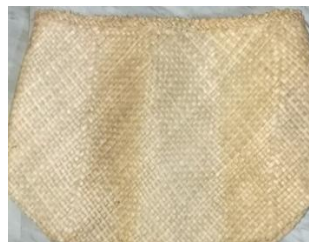
Gambar 6. Kem dalam tradisi Memere Nakan Pagit