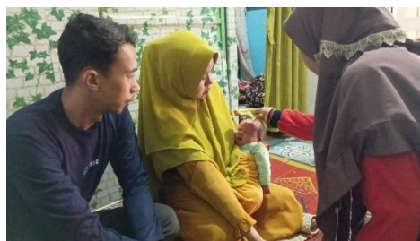
Gambar 15. Pengolesan kelembis dalam tradisi Mengkelembisi

“Jangan mati mendadak, jangan mati muda, jangan mati jatuh, jangan mati disambar petir, jangan mati kejatuhan kayu buruk, jangan mati hanyut, jangan demam, dan jangan nampak mata penjahat”