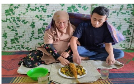
Gambar 11. Prosesi makan bersama tradisi Memere Nakan Pagit

3. Tahap penutup yaitu dengan makan bersama antara pihak keluarga pemberi dan penerima. Kegiatan ini tidak hanya berfungsi sebagai pelengkap rangkaian tradisi, tetapi juga memiliki makna sosial yang penting, yaitu sebagai wujud kebersamaan, rasa syukur, dan solidaritas antar anggota keluarga. Dalam suasana yang hangat dan penuh kekeluargaan, momen makan bersama ini menjadi sarana untuk mempererat hubungan kekerabatan, sekaligus menegaskan nilai gotong royong dan keharmonisan yang dijunjung tinggi dalam kehidupan masyarakat Pakpak.