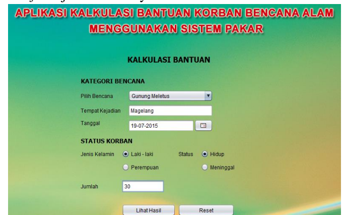
Gambar 3. Tampilan menu kalkulasi bantuan

Berikut ini tampilan menu kalkulasi bantuan pada Gambar 3, dengan contoh bencana gunung meletus dan tempat kejadian di Magelang pada tanggal 19 Juli 2015. Pada bagian status korban di radio button jenis kelamin memilih laki – laki, kemudian di radio button status memilih hidup, kemudian mengisi jumlah korban pada text field jumlah sebanyak 30.