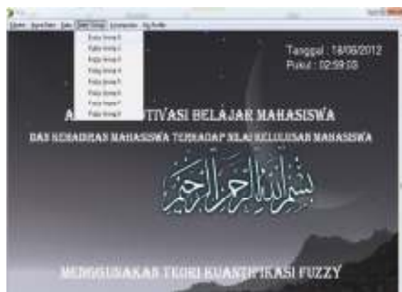
Gambar 3. Menu Analisis masing-masing Fuzzy group

Analisis fuzzy group-1 , diperlukan data karakteristik Fuzzy Quantification Theory I untuk menunjukkan hubungan antara Tekun Menghadapi Tugas dan kehadiran mahasiswa terhadap nilai akhir mahasiswa.