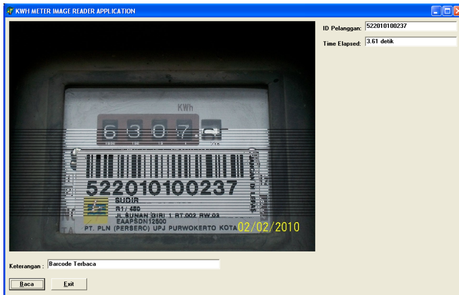
Gbr. 3 Salah satu contoh hasil pembacaan citra barcode