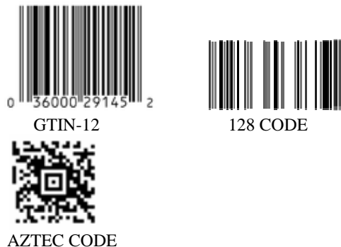
Gbr. 1 Barcode/UPC

Pada awalnya, UPC atau barcode merepresentasikan data dalam bentuk bar dan spasi. Kemudian dikembangkan barcode jenis lainnya seperti persegi, hexagon, lingkaran, dan bentuk-bentuk matriks dua dimensi [3]. UPC pada umumnya digunakan untuk identifikasi produk-produk industri tertentu, selain itu UPC juga digunakan untuk identifikasi buku di perpustakaan, identifikasi pelanggan, dan lain-lain (Gbr. 1).