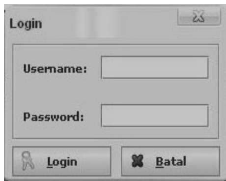
Gambar 3. Form login

Sebelum masuk ke sistem, diharuskan masukkan login sistem terlebih dahulu untuk keamanan sistem agar tidak terjadi pengaksesan secara ilegal dan penyalahgunaan aplikasi oleh pengguna yang tidak mempunyai hak untuk akses ke sistem (Gambar 3). Setelah user melakukan login sebagai admin , maka form yang ditampilkan akan berubah menjadi form admin (Gambar 4). Pada form admin akan ditampilkan yaitu menu sistem, menu setup data, menu sms dan menu konfigurasi.