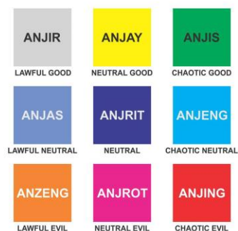
Gambar 1. Meme tahun 2017 tentang variasi makian anjing.

Tulisan ini hendak mengklasifikasi berbagai varian bentuk dari dasar anjing sebagai makian.