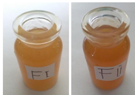
Gambar 2. Emulsi topikal mengandung ekstrak umbi bawang putih sebanyak 8% (F1) dan 12% (F2)

yaitu F1 memiliki nilai pH rata-rata 7,4 sedangkan F2 memiliki nilai pH rata-rata 6,9. Sediaan yang memiliki pH basa dapat meningkatkan muatan listrik negatif dari permukaan serat rambut sehingga dapat meningkatkan gesekan antar serat. Kondisi ini dapat menyebabkan kerusakan kutikula dan serat rambut (Dias et al., 2014).