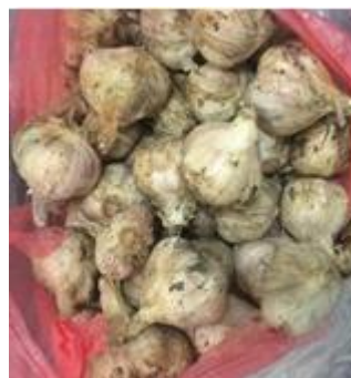
Gambar 1. Umbi bawang putih varietas lokal Solok, Sumatera Barat

Berdasarkan hasil penelitian sebelumnya, proses perajangan menyebabkan aktifnya CS-lyase (allinase) pada alliin. Proses ini menghasilkan senyawa allicin (diallyl-thiosulfinate) yang merupakan komponen paling aktif dalam bawang putih. Kandungan allicin adalah sekitar 70% dari semua senyawa thiosulfinat yang ada dalam bawang putih akibat proses penghancuran umbi (Rahman, 2007).