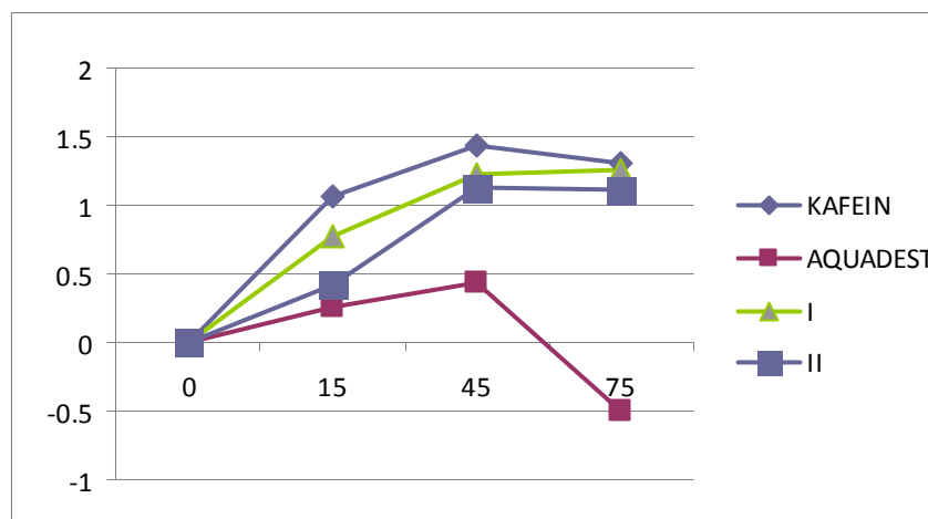
Gambar 1. Data waktu ketahanan berenang setelah perlakuan kombinasi nira aren dan air tebu pada tiap periode waktu pengamatan.

ketahanan berenang, dengan kata lain mampu memberikan efek antifatigue . Untuk melihat waktu ketahanan berenang. pada menit ke-45 dapat dilihat pada Tabel 2.