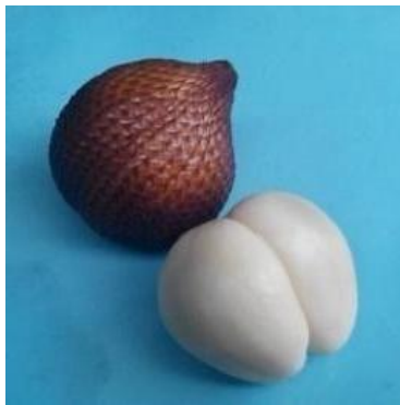
Gambar 1. Bentuk buah salak varian gula pasir.

Ukuran bijinya relatif kecil. Salah satu kelebihan dari buah salak varian ini adalah rasanya yang sangat manis seperti gula pasir, sehingga dinamakan salak varian gula pasir (Redaksi Agromedia Pustaka, 2009).