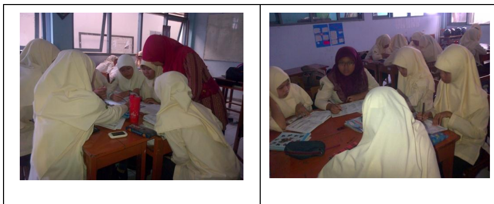
Gambar 2. Diskusi kelompok siswa dengan bimbingan dari guru

Dalam tahap ini sikap kerjasama sangat dikembangkan untuk menyelesaikan tugas yang diberikan oleh guru. Setelah berdiskusi siswa diberi kuis untuk menentukan peningkatan rata-rata nilai kelompok. kemudian memberikan penghargaan kepada kelompok yang mencapai peningkatan rata-rata tertinggi. Di akhir pelajaran guru memfasilitasi siswa dalam membuat rangkuman, mengarahkan, dan memberikan penegasan pada materi pembelajaran yang telah dipelajari. Dan di akhir siklus, guru memberikan tes kepada siswa secara individual.