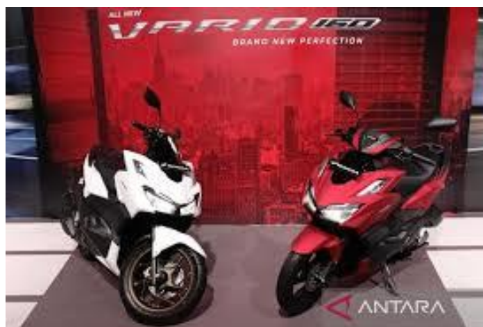
Gambar 1. Brosur Sepeda Motor Honda Vario 160